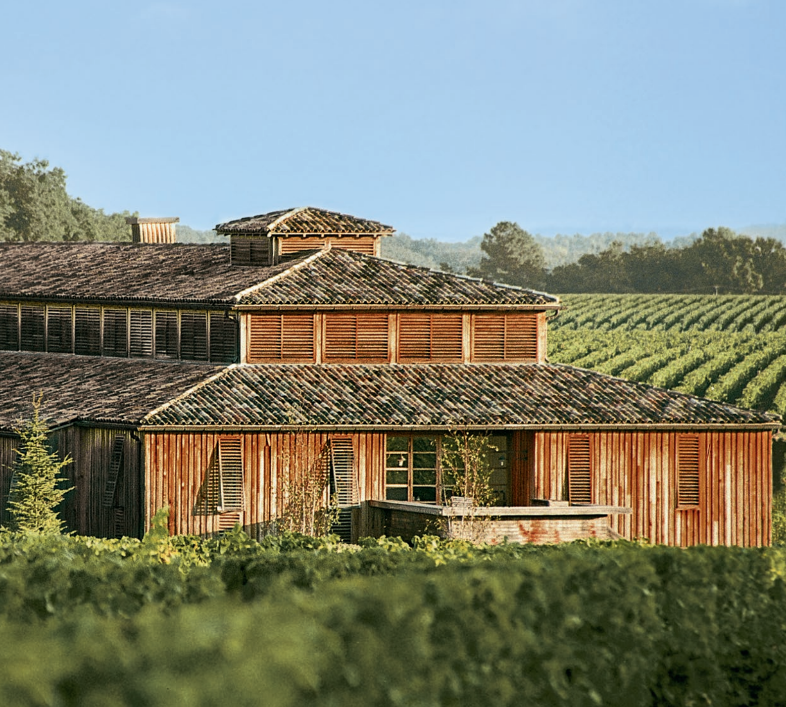
Caudalie, creator of the Vinothérapie Spa on the grounds of Château Smith Haut Lafitte (Bordeaux, France) since 1999. Caudalie, créateur des Spas Vinothérapie sur les terres du Château Smith Haut Lafitte (Bordeaux, France) depuis 1999.